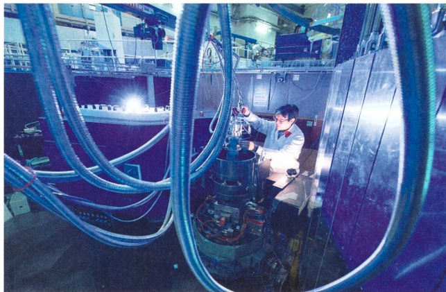
DAAD / Volker Lammert

«Damit kann sich die Forschung in Zukunft auf die Beziehung zwischen der Spin-Dynamik in nematischen Phasen und der Hochtemperatur-Supraleitung konzentrieren», sagt Jitae Park. No