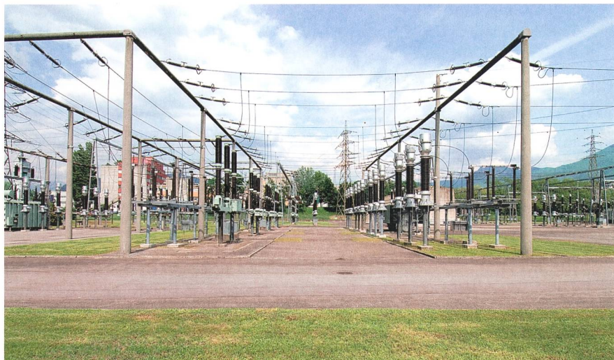
Figura 5 Sottostazione a Manno.

Secondo la sopraesposta corrente di pensiero, per i punti del contratto redatto in forma semplice che non rispettano i requisiti di forma – o che eventualmente non vengono ripresi nell'atto pubblico – valgono i principi citati in precedenza: nullità o privazione dell'effetto reale.