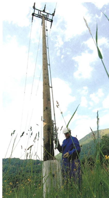
Figure: ALL SA

Questo ha permesso di contenere notevolmente i costi aggiuntivi del notaio plafonando un costo a corpo di CHF 250 per convenzione di servitù iscritta. Restano riservati costi per le eventuali autentiche di firma, copie conforme o casi speciali che richiedono prestazioni particolari del notaio.