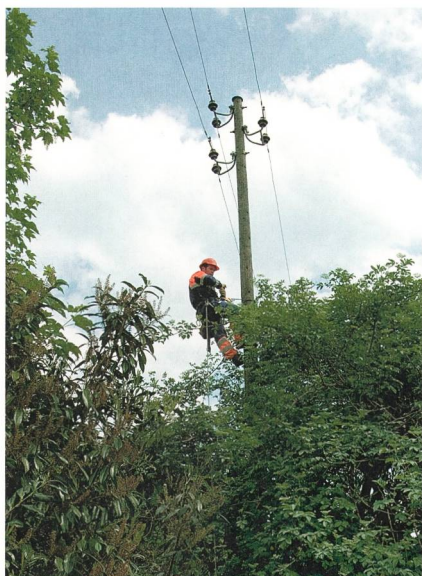
Figura 2 Linea aerea MT - zona Lugano centro.