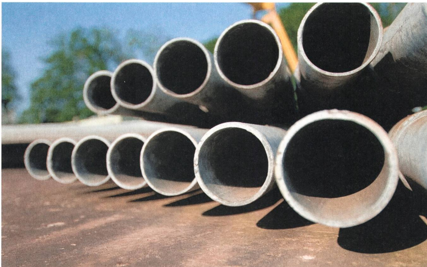
Figura 4 Stoccaggio tubi in magazzino.

prima di veder applicata la deroga dell'atto pubblico per i casi di applicazione dell'articolo 691 CC.