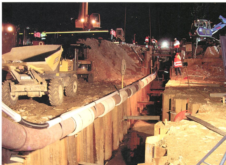
Figura 3 Cantiere notturno - lungo il fiume Vedeggio.

Dall'altro canto parrebbe un formalismo eccessivo pretendere sempre una decisione di espropriazione negativa