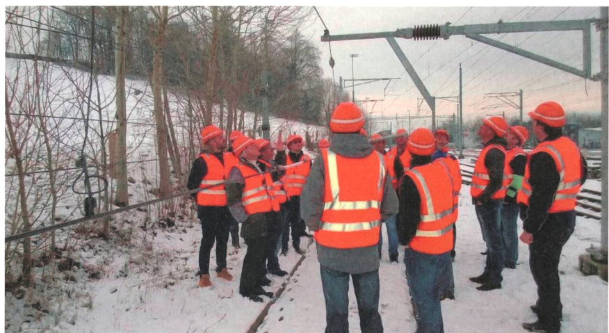
Die reformierte Berufsausbildung ist auch für die Berufsbildner eine Herausforderung. Im Bild: Impression aus dem Weiterbildungskurs «Berufsbildner/in Netzelektriker/in».

Der Lehrgang «Berufsbildner/in Netzelektriker/in EFZ» (Trägerschaft VSE, VöV und VFFK) bietet Berufsbildnerinnen und Berufsbildnern eine Hilfestellung, um sich schnell einen Überblick über die Anforderungen der neuen Berufsausbildung zu verschaffen. Die nächsten Durchführungen starten am 17. Juni 2015 sowie am 27. Oktober 2015. Weitere Informationen: www.strom.ch/veranstaltungen .