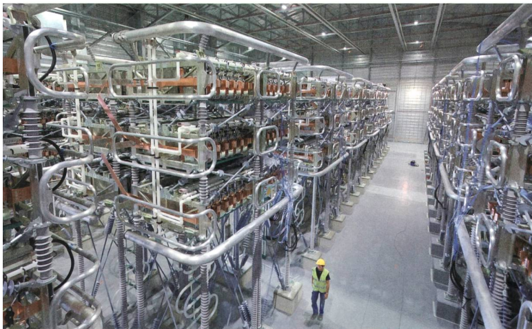
Die HVDC-Plus-Technik basiert auf selbstgeführten Stromrichtern (VSC) in modularer Multilevel-Converter-Bauweise (MMC), die den Wechselstrom in Gleichstrom – und umgekehrt – wandelt.

Die aktuelle Testphase soll bis Mitte Juni abgeschlossen sein. Danach wird das System der Betreiberin, dem Energieunternehmen Inelfe, übergeben.