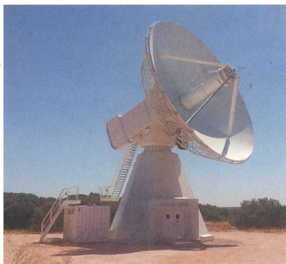
Über 13 m Durchmesser hat die Empfangsschüssel des Radioteleskops im spanischen Yeves.