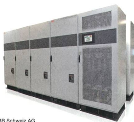
ABB Schweiz AG Power Protection / Newave Brown Boveri Platz 3, CH-5400 Baden Am Wald 36, CH-2504 Biel/Bienne Tel: +41 58 586 01 01 ups@ch.abb.com

Wenn ABB PCS100 USV-Lösungen eingesetzt werden. PCS100 ist eine einzigartige Produktfamilie, basierend auf wegweisenden Technologien. Hohe Verfügbarkeit mit geringstem Energieaufwand bedeutet mehr Produktivität. Egal ob für Nieder- oder Mittelspannung. Beide Systeme führen zu einem Mehrwert in der Industrie, bei der öffentlichen Elektrizitätsversorgung und bei kommerziellen Anwendungen. Erfahren Sie mehr unter: www.abb.ch/ups