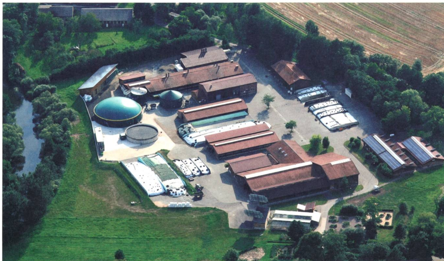
Hessisches Biogasforschungszentrum am Eichhof bei Bad Hersfeld.