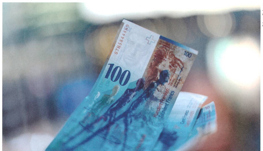
Bild 1 Kapitalnehmer sollten sich frühzeitig mit der Finanzierung eines Investitionsvorhabens auseinandersetzen und den Fokus dabei immer auf die Gesamtfinanzierung legen.

Entscheidend ist, dass sich das Energieunternehmen gegenüber möglichen Kapitalgebern gut präsentiert. Das Ausarbeiten eines detaillierten Businessplans dient neben einer Analyse der finanziellen Tragbarkeit bzw. der Bestimmung der maximalen Verschuldungskapazität auch Investoren zum besseren Risikoverständnis und zur Quantifizierung ihres Risikos. Eine fundierte Analyse ist der Schlüssel für eine erfolgreiche Finanzierung. So können Abhängigkeiten zwischen verschiedenen Planungsgrössen aufgezeigt oder Sensitivitäten und Szenarien mittels Variation signifikanter Parameter berechnet werden. Das Positionieren der Mitbewerber, die Abhängigkeiten von Schlüsselpersonen und das Darlegen der Stärken und Chancen gehören zum