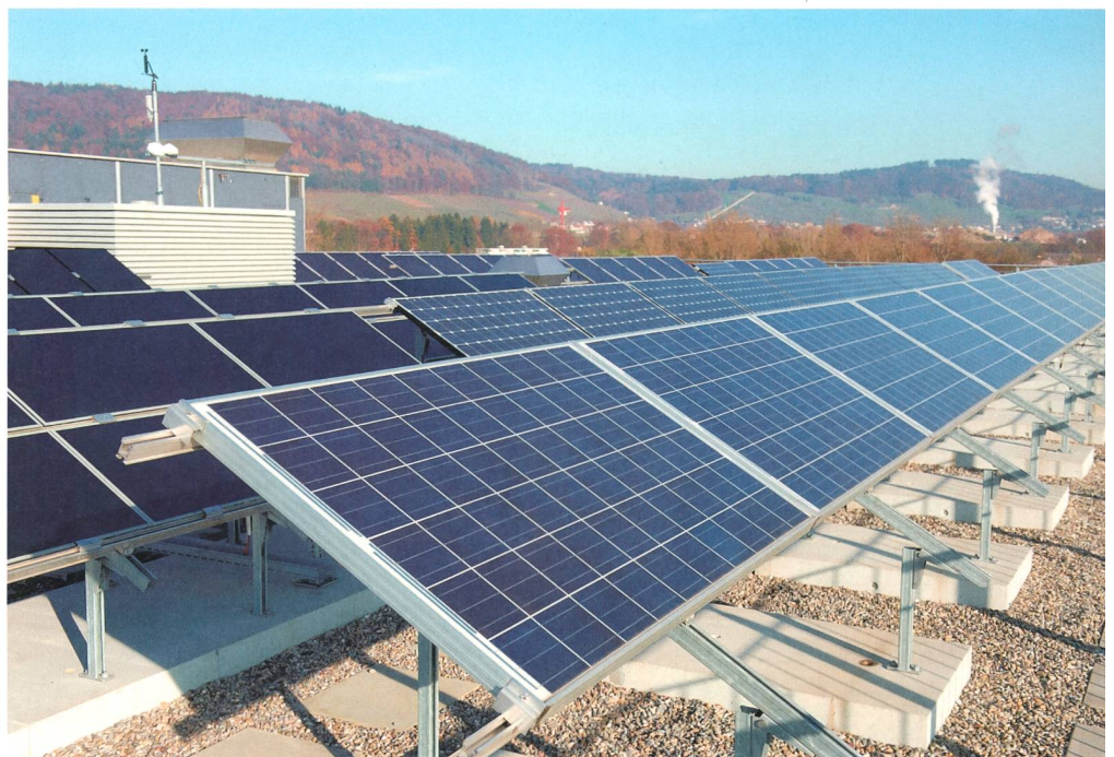
Bild 1 EKZ-Testanlage in Dietikon.

Die HIT-Module (Heterojunction-Technologie, basierend auf monokristallinen und dünnen amorphen Siliziumdeckschichten) von Sanyo haben sich seit den Messungen von 2012 auf etwa -3% unter der STC-Nennleistung stabilisiert und liegen damit ebenfalls deutlich innerhalb der Garantiegrenze von -6% (Linearisierung der Herstellerleistungsgarantie). Die Heterojunction-Technologie wird auch von der Schweizer Firma Meyer Burger angeboten und hat eine