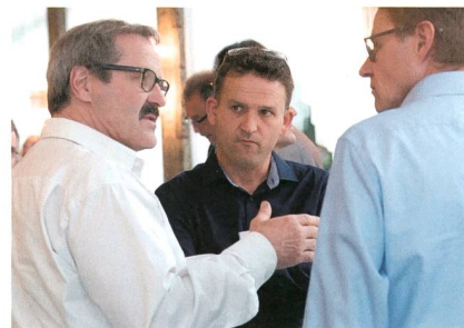
Die Betriebsleitertagung sorgte auch dieses Jahr für engagierte Diskussionen.