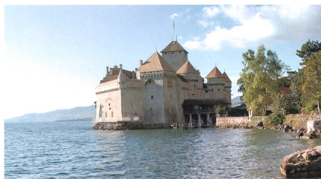
L'enceinte du Château de Chillon dégage une atmosphère appréciée en fin de journée.