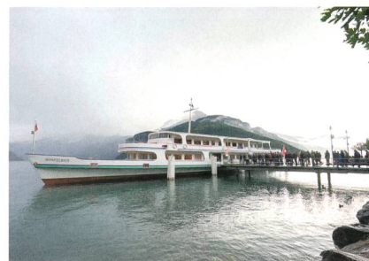
Im Anschluss an die Tagung stand der fast schon traditionelle Apéro auf dem See auf dem Programm.