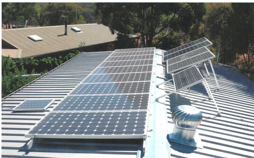
Bild 1 Eigenverbraucher mit einer Fotovoltaik-Anlage werden dank einer zusätzlichen Batterie zunehmend unabhängiger vom Verteilnetz.

Zu beobachten ist, dass die Abhängigkeit der Prosumer vom Verteilnetz stetig abnimmt. So lässt sich der Autarkiegrad der Prosumer von heute durchschnittlich