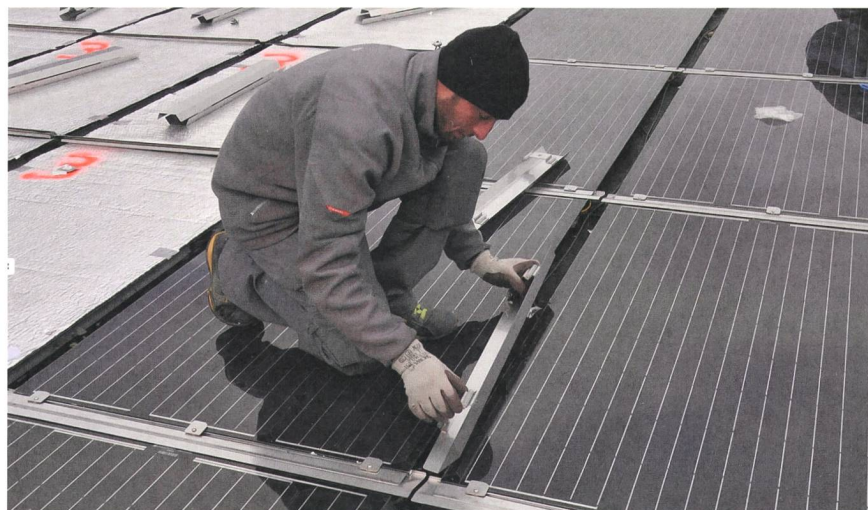
Das Dachelement TCR (Triactive Core Roof) der Firma Designergy SA vereint Wärmedämmung, Wasserdichtigkeit und Stromerzeugung durch Fotovoltaik.