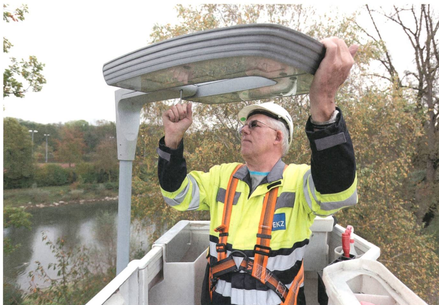
LED-Strassenleuchten sind an sich schon energieeffizient. Werden sie verkehrsabhängig gesteuert, erhöht sich die Effizienz noch.

Die EKZ testen in ihrem Zürcher Netzgebiet mit zwei Pilotprojekten das bedarfsabhängige Regulieren der Helligkeit von Strassenleuchten. Das sogenannte «vorausseilende Licht» und das «verkehrsbeobachtende Licht» haben beide für die Verkehrsteilnehmer keine Einschränkungen. Das «vorausseilende Licht» steuert das Lichtniveau geschwindigkeitsabhängig. Die Sensoren können zwischen bestimmten Verkehrsteilnehmern unterscheiden und drei bis vier Leuchten erhellen im Voraus nur