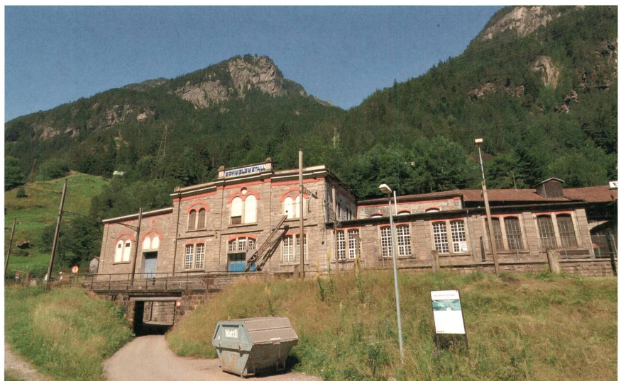
Bild 1 Kraftwerksgebäude in Gurtellen.

Bei dem Erneuerungsprojekt stand neben der Optimierung der Gesamtanlage insbesondere die Steigerung der Produktionsmenge im Vordergrund. Dies, weil die jetzige Anlage bezüglich der Wasserführung des Gornerenbachs nicht optimal ausgebaut ist: An über 100 Tagen im Jahr herrscht Überschusswasser, das ungenutzt über die Wehranlage fliesst. Dieses Überschusswasser soll künftig ef-