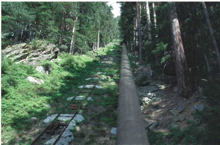
Bild 2 Die zu ersetzende Druckleitung.

fizienter genutzt werden. Hierfür wurden im Rahmen einer umfassenden Evaluierung zunächst sechs Varianten ausgearbeitet. Die Entscheidung fiel schliesslich zugunsten einer Laufwasserkraftwerk-Variante, die eine Erhöhung der Ausbauwassermenge von 1,4 \text{ m}^3/\text{s} auf 2 \text{ m}^3/\text{s} sowie die installierte Maschinenleistung von bislang 6 MW auf 10 MW vorsieht. Damit wird eine Produktionssteigerung von rund 23% gegenüber dem bisherigen Werk möglich.