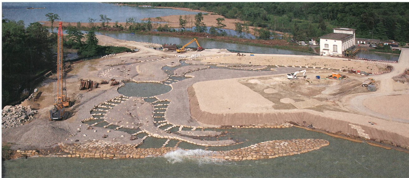
Bild 4 Viel Raum wurde der Fischgängigkeit eingeräumt. Hinten sieht man das alte Kraftwerk.