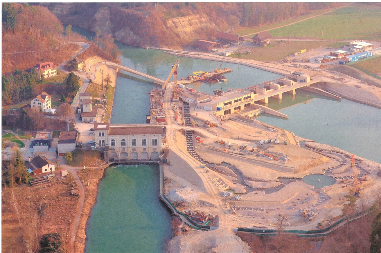
Bild 1 Bau des neuen Wasserkraftwerks (rechts) mit markantem Fischumgehungsgerinne (vorne).

Das Werk erfüllt damit nicht nur hohe ökologische Anforderungen, es fügt sich auch architektonisch schön in diese schützenswerte Landschaft ein. Da auf