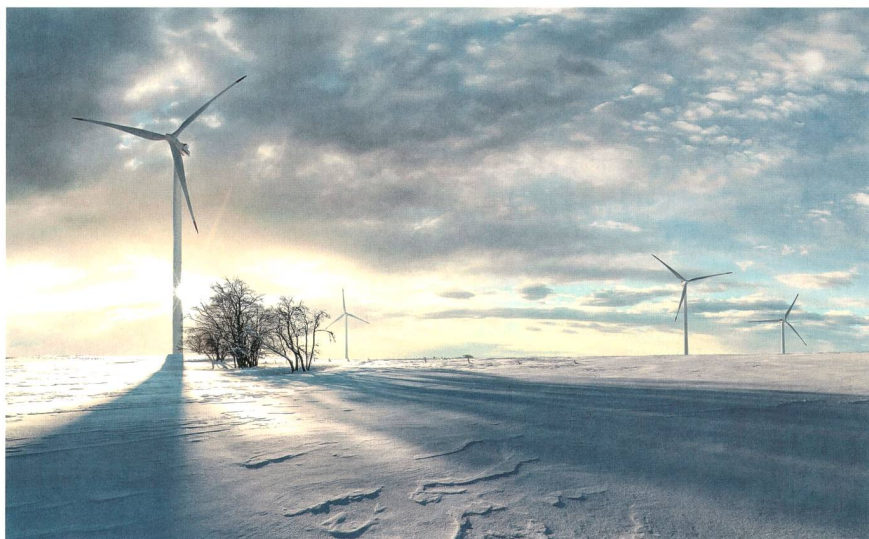
Windpark im Norden, Symbolbild.

Die BKW will ihr Windkraftportfolio weiter ausbauen. BKW CEO Suzanne Thoma: «Wir sind stolz, Teil des grössten Onshore-Windkraftprojekts in Europa zu sein und dadurch unsere Strategie im Bereich Entwicklung erneuerbarer Energien umsetzen zu können.» No