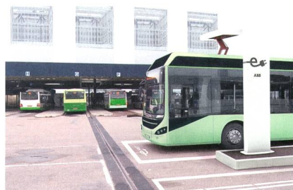
Schnellladelösung mit Remote-Diagnose.