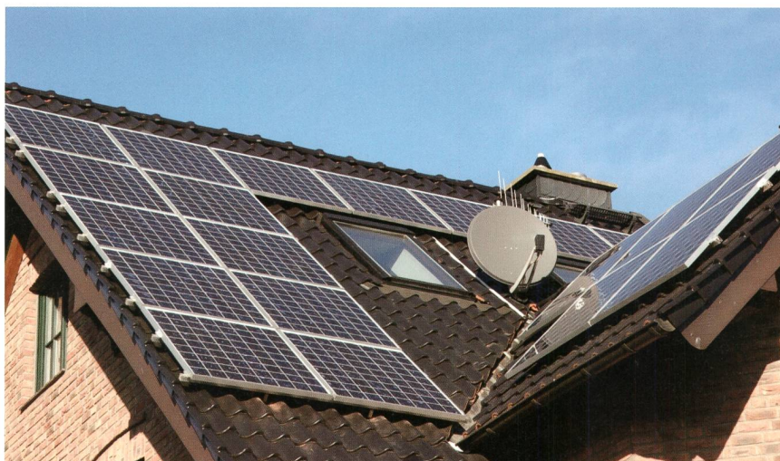
Bild 1 Mit der zunehmenden Autarkie der Endverbraucher, die auch Strom produzieren, ergeben sich neue rechtliche Fragestellungen.

Wer Strom produziert, kann diesen am sogenannten «Ort der Produktion» sowohl selber verbrauchen, wie auch an einen beliebigen Dritten, mit einschliessend an sogenannte «feste Endverbraucher», verkaufen. Dies gilt auch bei Arealnetzen, solange dafür nicht das Netz eines Netzbetreibers gemäss StromVG beansprucht werden muss – was Letzterer allerdings mit Anspruch auf Entgelt genehmigen könnte – oder dadurch nicht der stabile Netzbetrieb