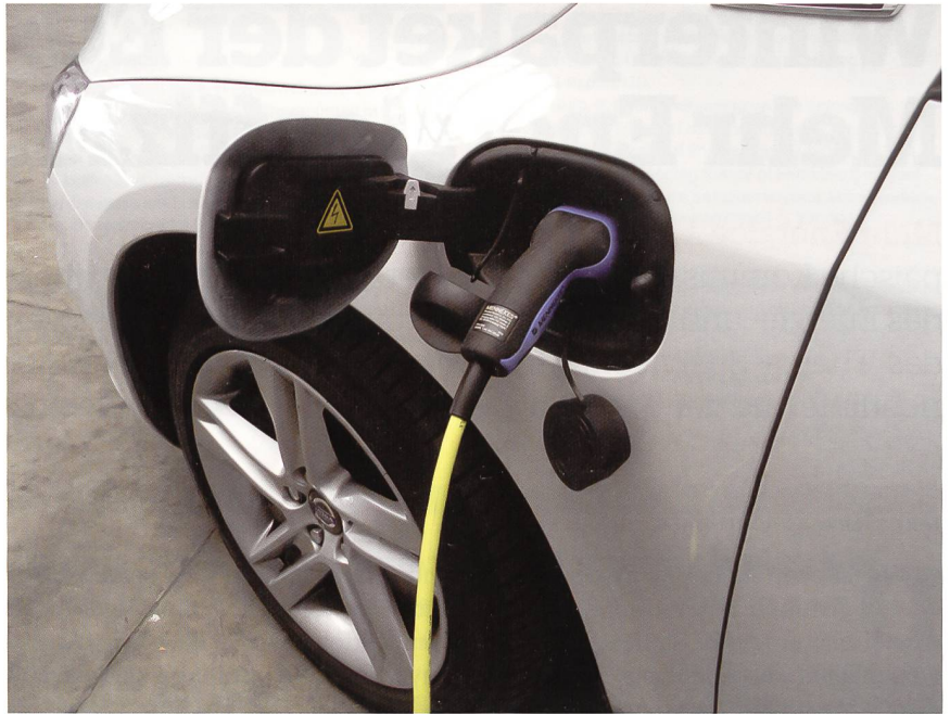
Die Vorschläge der Europäischen Kommission sehen ab 2025 auch zwingend Ladestationen für Elektroautos in Neu- und Umbauten ohne Wohnzweck vor.

Das Europäische Parlament hatte im vergangenen Jahr in einem unverbind-