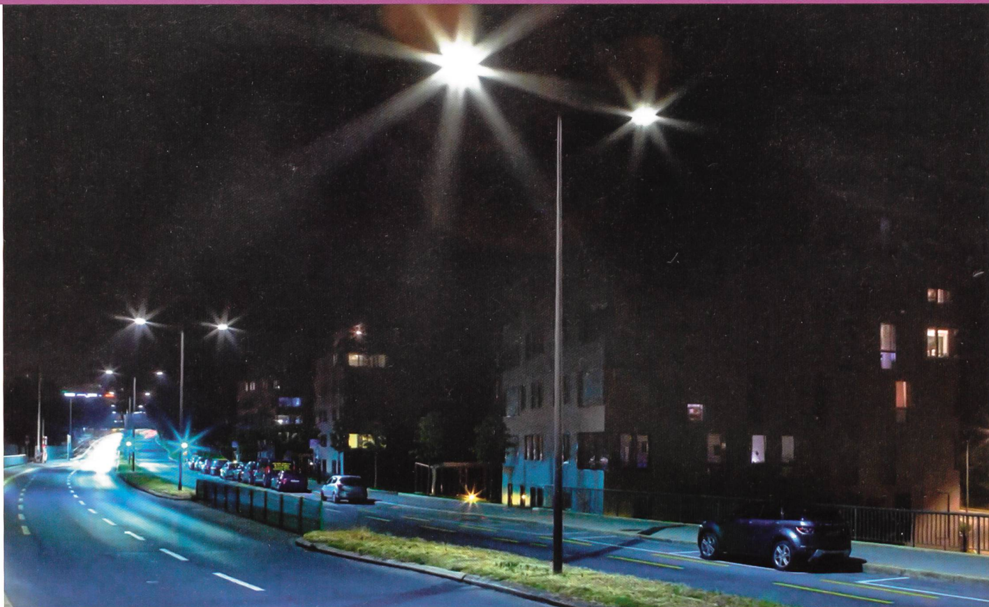
Figure 1 À Lausanne, 50 lampadaires de l'avenue de Provence sont dotés de capteurs intelligents. Ils permettent aux services industriels de la ville d'en contrôler l'intensité lumineuse à distance. [1]