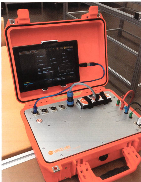
Bild 4 Die Auswerteelektronik wird von einer Batterie gespeist und die Auswertung der Messung erfolgt direkt auf dem Tablet mit Touch-Screen.