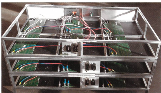
Bild 3 Die Beleuchtungseinheit des PLF lässt sich in drei Teile trennen und stapeln. Der Transport wird so deutlich vereinfacht.