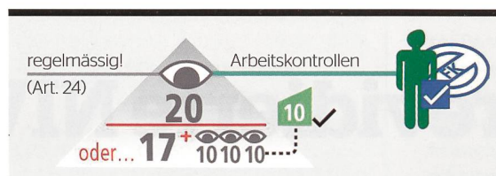
Bild 3 Bis 20 Personen genügt ein fachkundiger Leiter, aber er muss vollzeitlich beschäftigt sein.

eine verbesserte Sicherheit der Installationsarbeiten und schliesslich der elektrischen Anlagen.