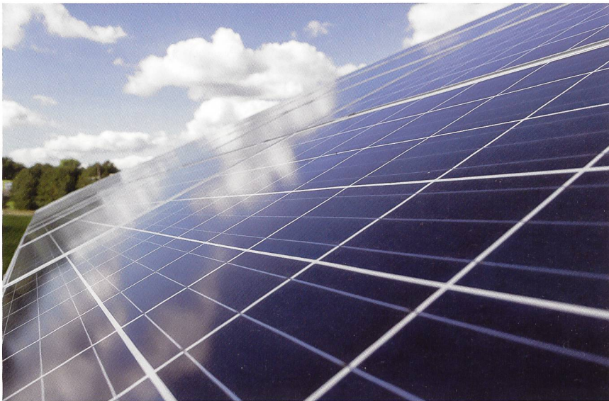
Der Betreiber von drei Photovoltaikanlagen brachte diesen Stein ins Rollen.

werden muss und Quersubventionierungen zwischen dem Netzbetrieb und anderen Tätigkeitsbereichen zu unterbleiben haben. In Art. 10 Abs. 2 und Abs. 3 StromVG werden dann die konkreten Massnahmen zur Verhinderung der Quersubventionierung umschrieben, die einerseits aus dem Verbot der Weitergabe und Nutzung von wirtschaftlich sensiblen Informationen in andere Tätigkeitsbereiche und andererseits aus der buchhalterischen Entflechtung des Verteilnetzbereichs von den übrigen Tätigkeitsbereichen bestehen.