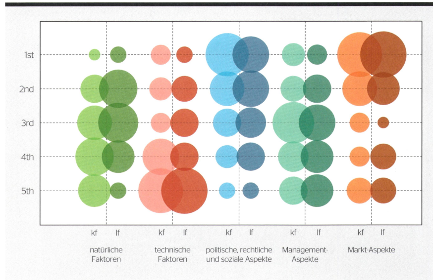
Bild 1: Ranking der Bedeutung der kurz- (kf) und langfristigen (lf) Einflussfaktoren auf die Schweizer Wasserkraft. [1]

Mit dem erhöhten Preisdruck auf den europäischen Strommärkten rückt die Frage in den Fokus, ob nicht die hohe Flexibilität der Wasserkraft einen Mehrwert generieren könnte, welcher sich in höheren Einnahmen widerspiegelt. Dabei gibt es aktuell zwei Markt-