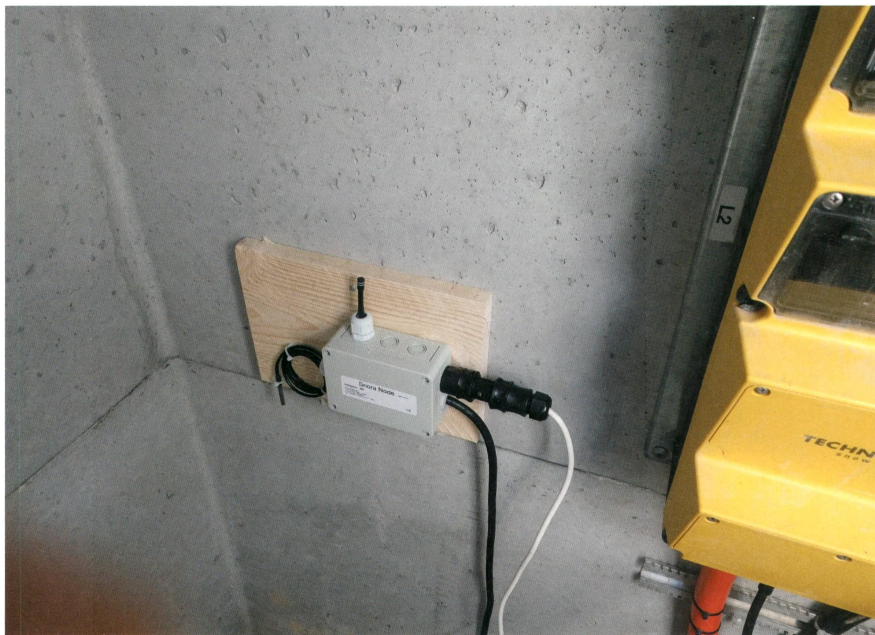
Bezüglich Installation ist Snora flexibel.

Dies führte zum Projekt «Snora», einem vernetzten System für die Steuerung von Elektroheizungen. Der Begriff Snora setzt sich zusammen aus: «Snow» und dem «Lora»-Netzwerk (Long Range Wide Area Network), einem Low-Power-Wireless-Netzwerkprotokoll, das für Kommunikation im Internet der Dinge entwickelt wurde.