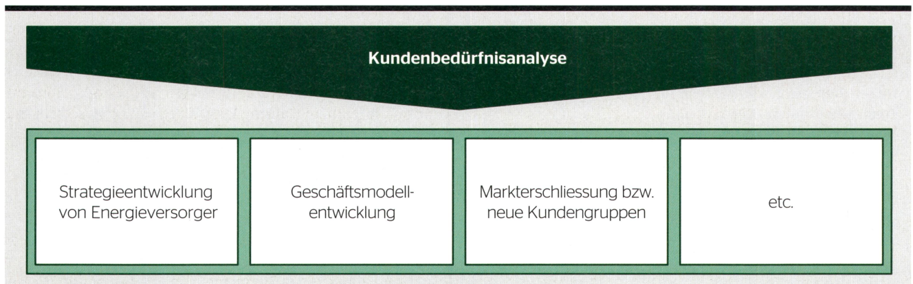
Bild 3 Einsatzmöglichkeiten von Kundenbedürfnisanalysen.