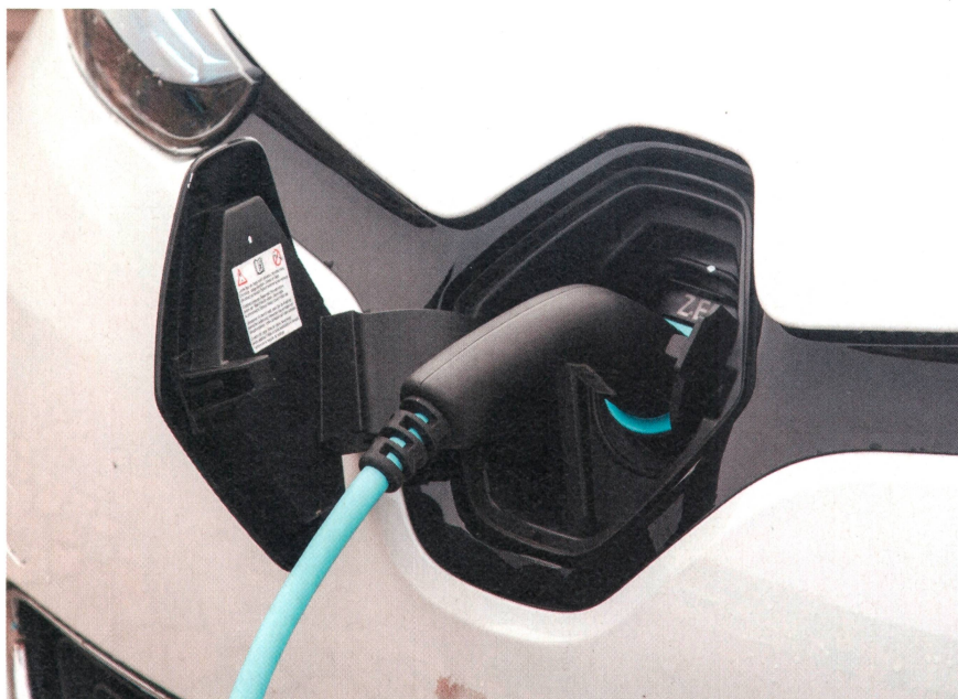
In Zukunft wird noch mehr Strom getankt.

Die geläufigen Business-to-Business- oder Business-to-Consumer-Geschäftsmodelle sind in anderen Lebensbereichen längst um Consumer-to-Consumer-Geschäftsmodelle, wie zum Beispiel Airbnb, ergänzt worden. Ermöglicht hat viele dieser Entwicklungen das Internet. Die Realisierung vergleichbarer Geschäftsmodelle in der Stromversorgung ist sicher kom-