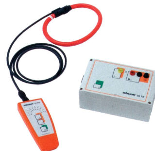
CI - Cable Identifier.

Eaton Industries GmbH, 8307 Effretikon Tel. 058 458 14 14, www.eaton.ch