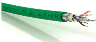
Ermöglicht eine schnelle Montage.

Schurter AG, 6002 Luzern Tel. 041 369 31 11, schurter.com