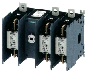
Verhindert Schäden an Bauteilen.

Demelectric SA, 8954 Geroldswil Tél. 043 455 44 00, www.demelectric.ch