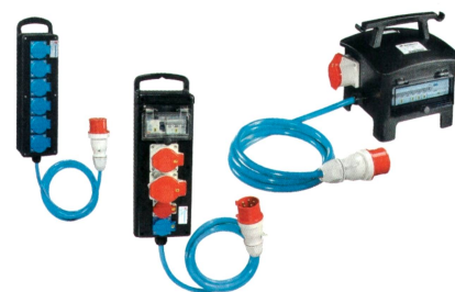
Pratiques, compacts et solides.

Volland AG, 8153 Rümlang Tel. 044 817 97 97, volland.ch