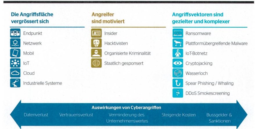
Bild 1 Die Bedrohungslandschaft entwickelt sich kontinuierlich.

Prescriptive Security erweitert die Grenzen eines dreidimensionalen Paradigmas – mit grösserer Erken-