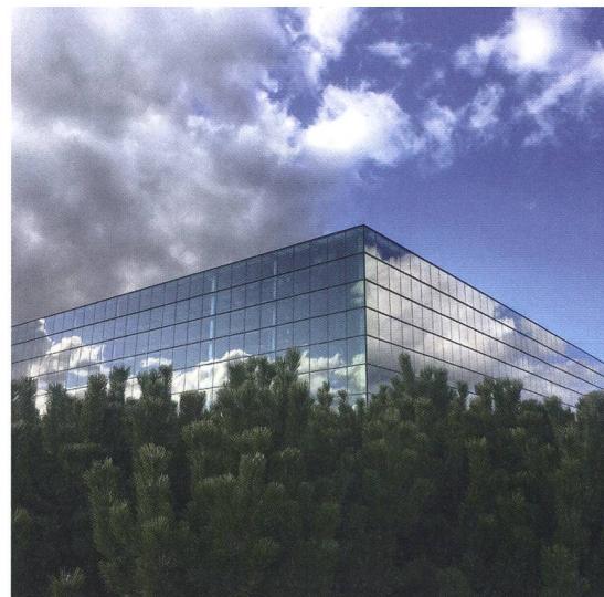
Grossflächig verglastes Gebäude.

Smarte Glaslösungen – wie zum Beispiel elektrochrome (elektrisch gesteuerte Lichtdurchlässigkeit) und thermochrome (temperaturgesteuerte Infrarot-Reflexionseigenschaften) Fenster und Glasfassaden – können den Heiz- und Kühlbedarf grosser Gebäude drastisch senken. Zudem bieten sie einen höheren Beleuchtungskomfort als mechanische Sonnenschutzvorrichtungen. Das Switch2Save-Projekt zeigt, dass die Umsetzung in zwei Klimazonen (Athen und Stockholm) ein Heiz-/Kühl-Energiesparpotenzial zwischen 10 % und 70 % im Vergleich zu dreifach verglasten Fenstern mit Innenbeschattung bringt. NO