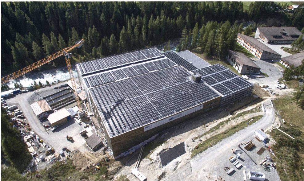
3447 Solarmodule befinden sich auf dem Dach der ARA Oberengadin in S-chanf.