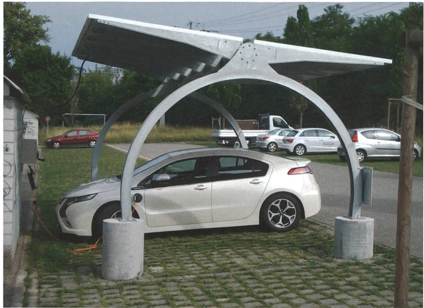
Der Solarcarport der BFH-TI in Burgdorf.

Die alte Branche wird sich noch eine Weile wehren und das Elektroauto schlechtreden. So hören wir plötzlich kritische Diskussionen über Batterien, Recycling, Lithium und anderes mehr. Bei den Verbrennern hatten solche Diskussionen Seltenheitswert. Wer will schon Genaueres über die Menschenrechtssituation in Saudi-Arabien oder die Förderung von Rohöl wissen? Kommt dazu, dass die Industrie heute noch nicht in der Lage ist, Komponenten wie Batterien, Leistungselektronik und Motoren in der nötigen Stückzahl