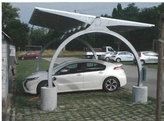
L'ombrière photovoltaïque de la BFH-TI de Berthoud.

L'ancien secteur automobile va encore se défendre quelque temps en dénigrant la voiture électrique. C'est la raison pour laquelle nous entendons soudain des débats critiques sur les