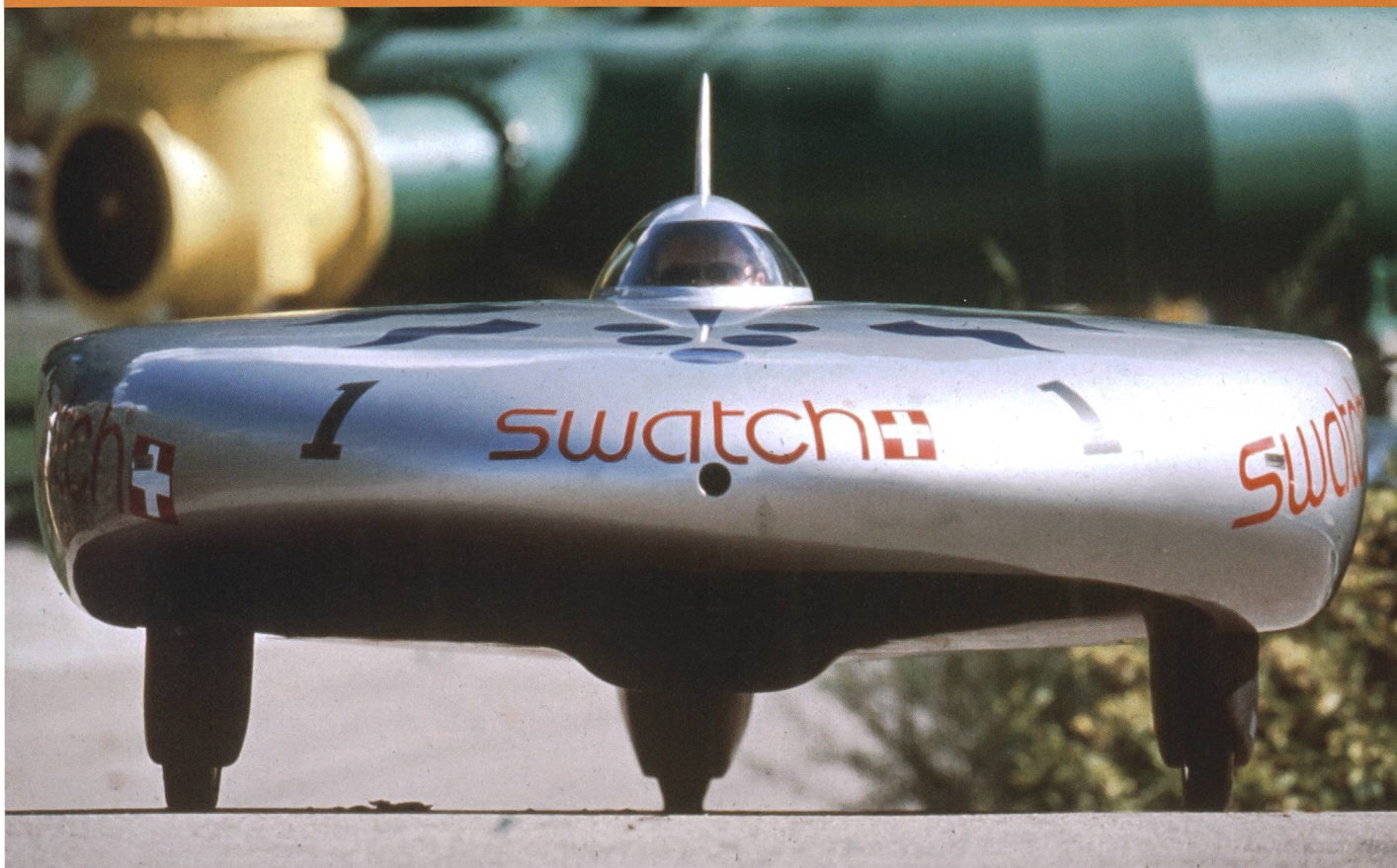
Le Spirit of Biel/Bienne II de l'ancienne École d'ingénieurs de Bienne, en 1993.