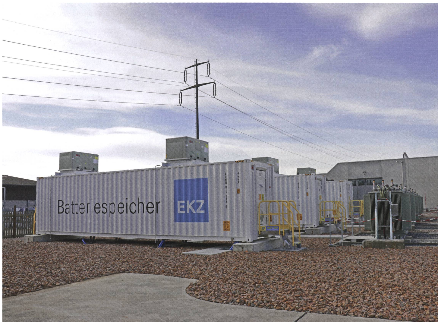
Der Batteriespeicher in Volketswil hat eine maximale Leistung von 18 MW und kann 7,5 MWh speichern.

Die Kategorie der Speicher existiert in der bisherigen Energiegesetzgebung nicht. Der Ansatz, Speicher für die aus dem Netz bezogene Energie als netzentsgeltpflichtige Endverbraucher und für die wieder ins Netz eingespeiste Energie als Produzent zu betrachten, ist nicht richtig und diskriminierend. Ein Speicher bezieht die Energie nicht für den eigenen Verbrauch (abgesehen