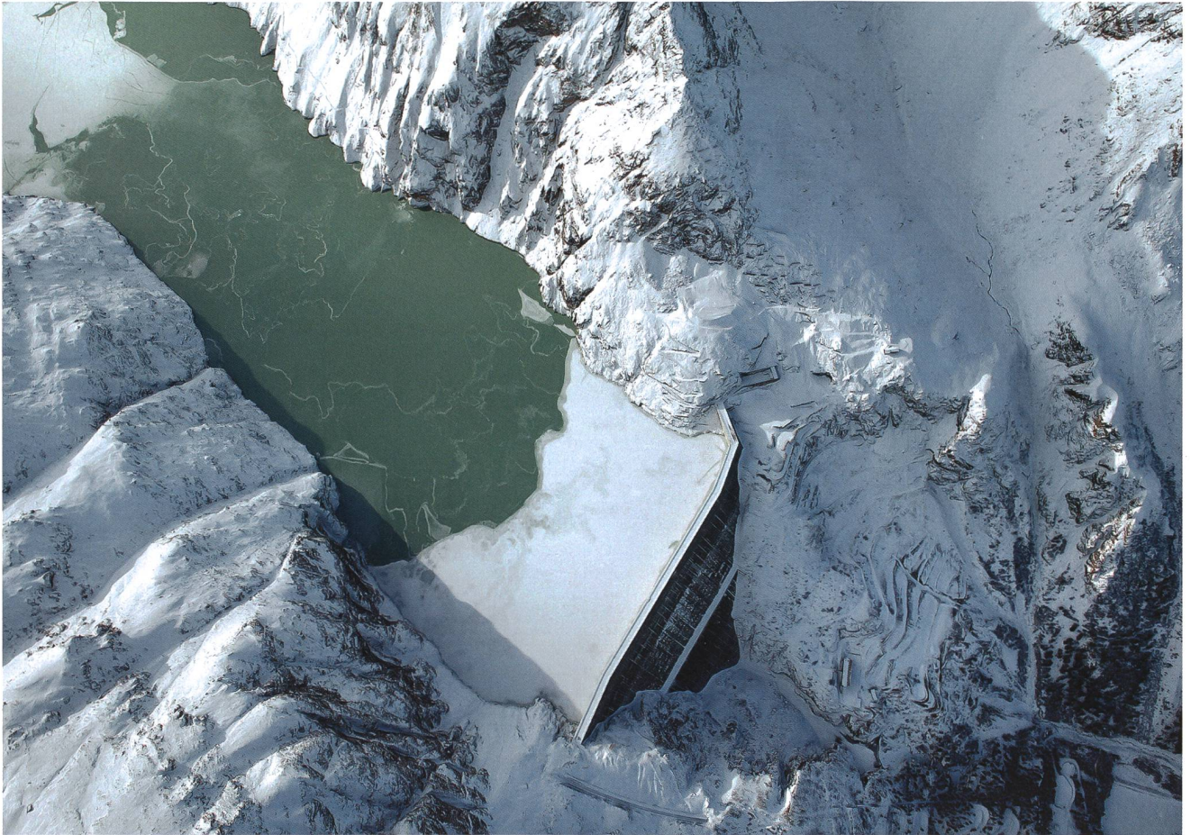
Staumauer Grande Dixence.