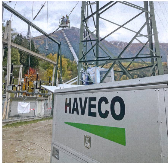
Anpassung der Leitungseinführung im UW Bitsch.

Mit Pfiffner Systems haben wir in der Schweiz einen Anbieter für Schaltanlagen-Systemlösungen etabliert, der vor