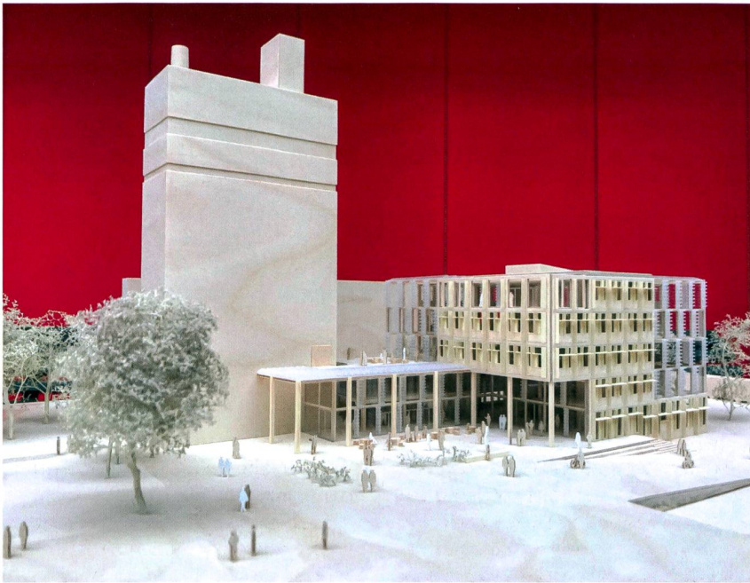
Maquette des neuen Gebäudes Smart Living Lab.

keit des Smart Living Labs besteht darin, dass Architekten und Bauingenieure, Statiker, Gebäudetechniker, Elektrotechniker, Informatiker, Wirtschaftswissenschaftler und die besten Baurechtsexperten unter einem Dach vereint sind und sich kennen.