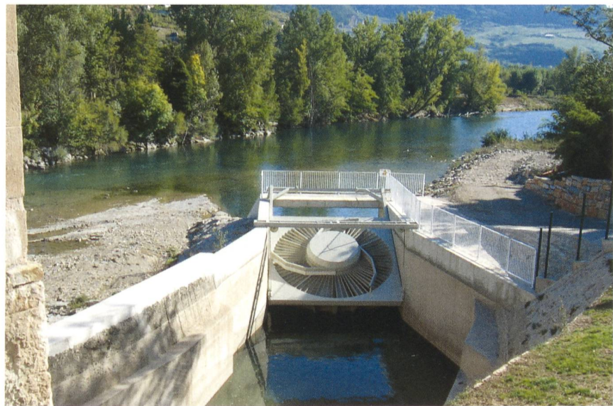
Figure 2 Exemple de turbine VLH en position levée.

doute face à l'avenir a été levé récemment. Depuis le 23.11.2022 [3], il est en effet établi que la CI s'applique depuis le 01.01.2023 aux nouvelles installations, avec toutefois une limite inférieure de puissance de 1 MW pour le turbinage des cours d'eau. C'est notamment cette limite inférieure que l'initiative populaire de Swiss Small Hydro demande de supprimer [4].