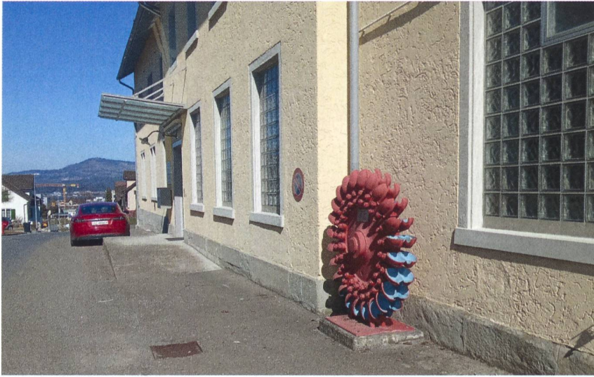
Figure 3 Située à proximité de la sortie d'autoroute de Lachen, dans le canton de Schwyz, la petite centrale de Spreitenbach a été retenue pour l'étude des modèles économiques dans le cadre du projet Small-Hydro Mobility.