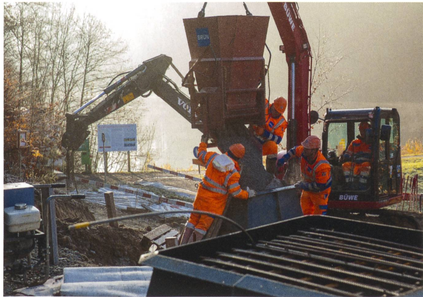
Bau der Mastfundamente beim Waldweiher.

Die Koordination der Ausschaltung stellt hier die grösste Herausforderung