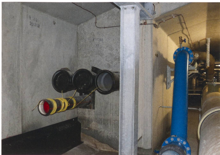
Die Kabel der neuen 220-kV-Leitungen verlaufen im Uetlibergtunnel unter der Fahrbahn. Sie werden in bereits erstellte Rohrböcke neben dem Werkleitungskanal eingezogen.

dar, denn sie muss mit allen vier Partnern abgestimmt werden: