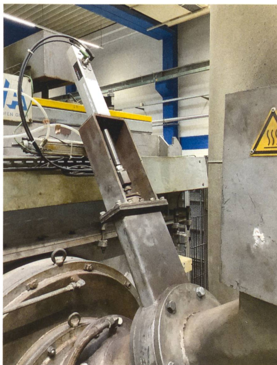
Bild 2 Die Firma Stihl Kettenwerk war eines der Unternehmen, bei denen Druckluftzylinder durch Elektrozyylinder ersetzt wurden.

werden. Grundlage der Berechnung war der Einsatz von Elektrozyindern in mehreren Pilotbetrieben.