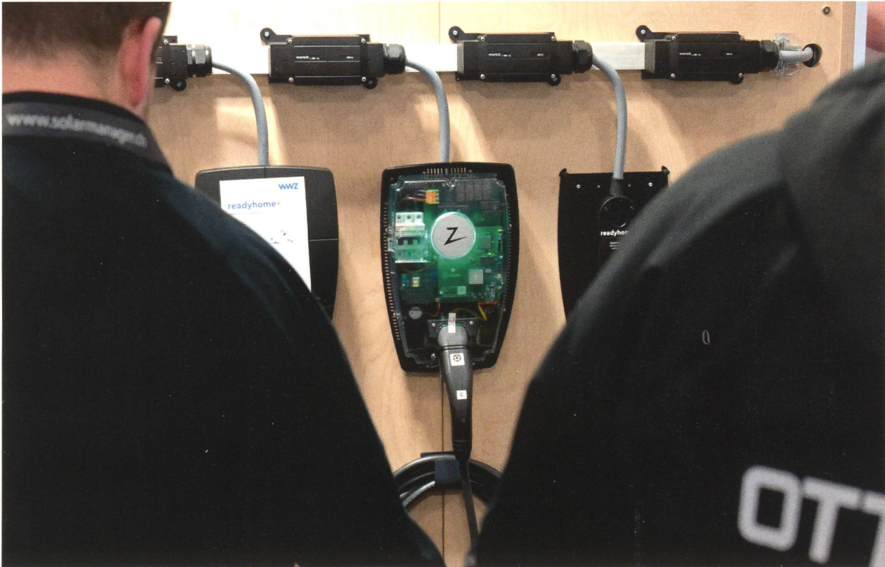
An der begleitenden Ausstellung wurde ein breites Spektrum an Ladelösungen und Energiesystemen vorgestellt.