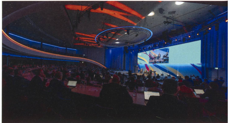
Environ 400 personnes ont assisté au Congrès suisse de l'électricité au Kursaal, à Berne.