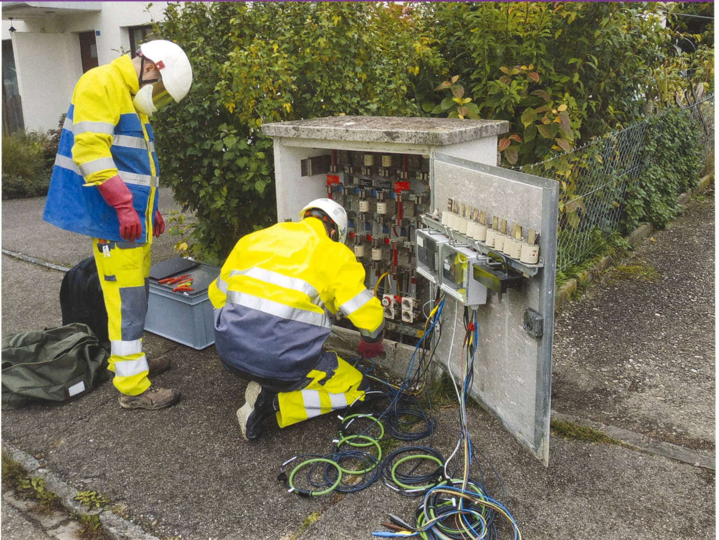
Installation der PQ-Messgeräte in einer Verteilkabine.