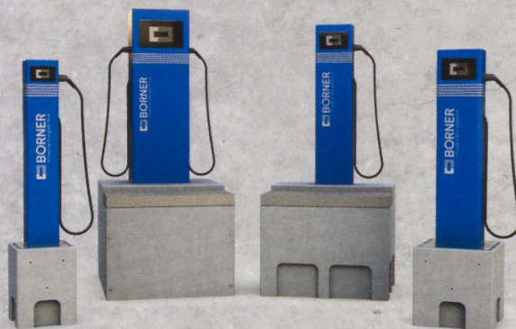
E-Mobilität ENERGY CUBE