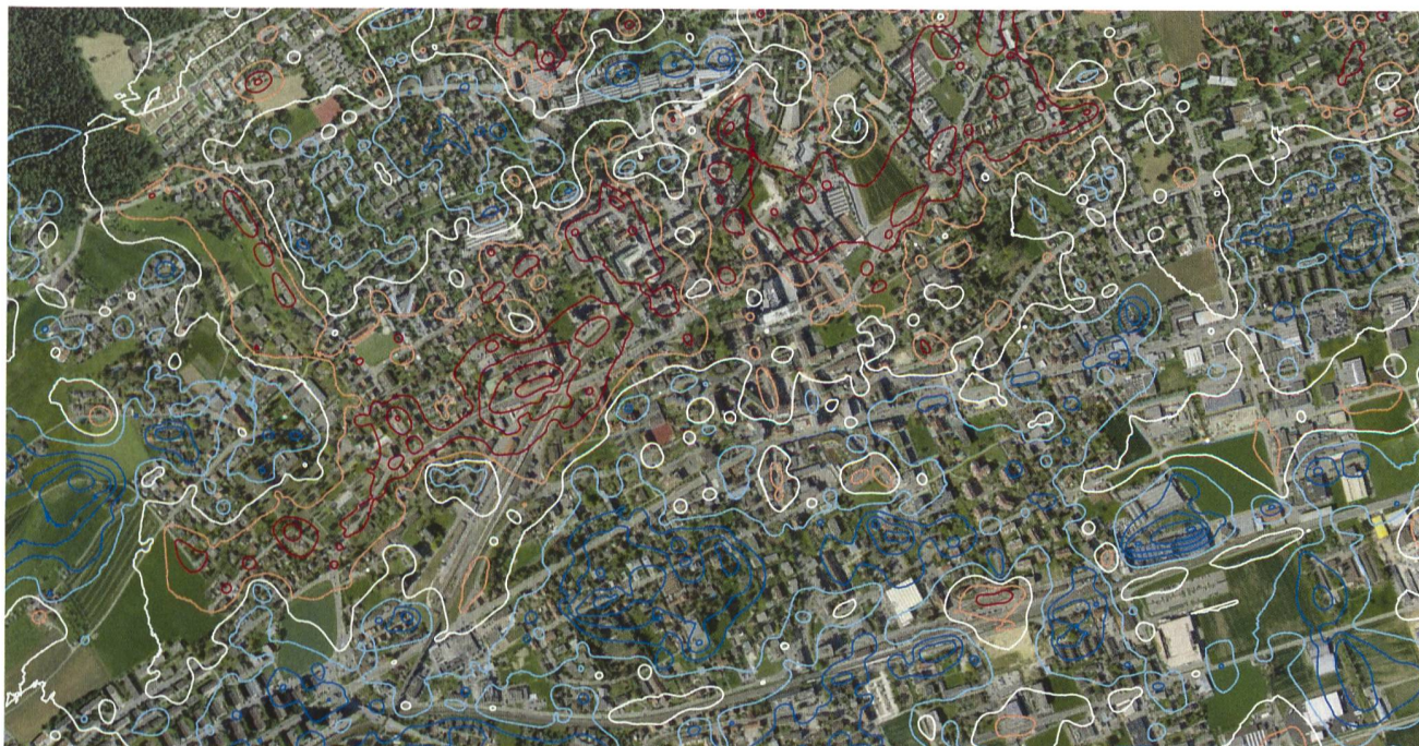
Darstellung der Mikroklimate eines Projektteilgebiets (Isolinien).