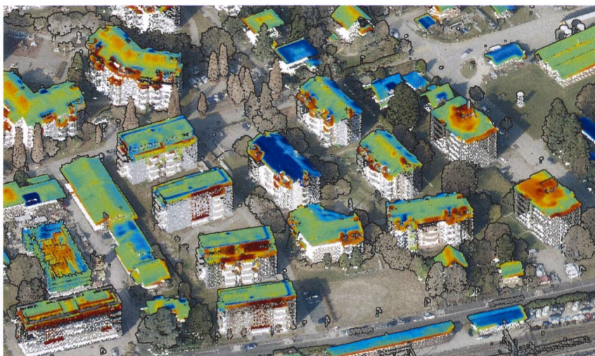
Bild 1 Hochaufgelöste Thermalaufnahmen der Dächer zeigen die Wärmeabstrahlung von blau (kälter) bis rot (wärmer) auf dem Hintergrund eines 3D-Oberflächenmodells (aus Lidar-Daten) eingefärbt mit Information aus RGB-Luftbildern.

Lokale Charakteristiken einer Siedlung haben einen Einfluss auf die erfassten Dach- und Fassadentemperaturen. So kann zum Beispiel ein von Mehrfamilienhäusern umschlossener grüner Spielplatz mit Bäumen die umliegenden Fassaden kühlen, während die lokale Wärmeinsel einer grossen Strassenkreuzung die umliegenden Gebäudefassaden erwärmt. Mikroklimata müssen bei der Evaluation der Gebäudetemperaturen berücksichtigt werden, damit auch Dächer und Fassaden von verschiedenen Stadtgebieten mit unterschiedlichem Mikroklima miteinander verglichen werden können. Die Mikroklimata eines Aufnahmegebiets wurden im ThermoPlaner3D-Projekt auf der Basis des Turn-Algorithmus [1] berechnet und detektiert. Grundsätzlich wird angenommen, dass das Strassennetzwerk gleiche oder zumindest sehr ähnliche Eigenschaften über das ganze Gebiet aufweist. Wird nun an zufällig verteilten Orten auf den Strassen die erfasste Temperatur verglichen, kann davon ausgegangen werden, dass Unterschiede in der Temperatur auf lokale Kälte- oder Wärmeinseln zurückzuführen sind. Mit diesem Verfahren lassen sich Mikroklimata eines Gebiets