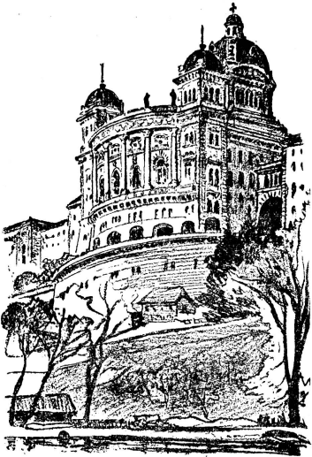
Eine von Vielen

Wirtschaftskommission, die Zentralstelle für Frauenberufe u. a. m. immer wieder die neuen Aufgaben an die Hand nehmen und sie gründlich und sachgemäß behandeln. Während der ganzen 50 Jahre hat der Bund wie ein richtiges Frauen-Parlament die gesetzgeberische Arbeit auf dem Boden der Eidgenossenschaft verfolgt, kritisiert, und so wenig wirkungsvoll als dies ohne die politischen Rechte unvermeidlich ist, aber so gut als es durch die Kraft der Überzeugung und des Verantwortungsgefühls der Schweizerfrauen, ja dem ganzen Volk gegenüber überhaupt möglich war versucht, einen Einfluss auf unsere Männer-Gesetze auszuüben.