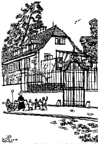
Kinderheim der Diakonissenanstalt

Als im Jahre 1929 von der Diakonissenanstalt ein Landgut in Riehen übernommen werden konnte, wurde ein Häuslein in demselben zum Kinderheim bestimmt. Ein langjähriger Wunsch, auch den Kindern dienen zu können, ging dadurch in Erfüllung.