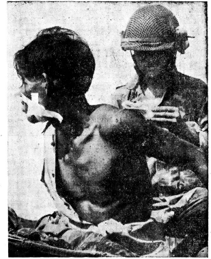
Ob Freund oder Feind, ist der verwundete Soldat ein menschliches Wesen, das der Pflege bedarf. Dieser, einer der wichtigsten humanitären Begriffe, ist in der ersten Genfer Konvention von 1864 enthalten und dadurch im internationalen Recht und im menschlichen Gewissen verankert. Das Internationale Komitee vom Roten Kreuz kann als ständiger Anreger der Genfer Abkommen betrachtet werden. Um ihm die Durchführung seiner humanitären Aufgabe zu ermöglichen, hofft das Internationale Komitee vom Roten Kreuz wiederum auf die Unterstützung des Schweizer Volkes

Und ob all diesen Ueberlegungen kommen wir zum letzten, tiefsten Sinn dieses Feiertages, zur Busse. Busse vor allem in dem Sinn, dass wir ehrlich vor Gott und uns selbst eingestehen, wo wir versagt, gefehlt haben, damit wir mit neuem guten Willen versuchen, über unser Versagen und Fehlen hinaus zu kommen, um es in Zukunft besser zu machen. Busse darüber, dass wir mehr und mehr glauben, Gott, seine Gebote, seinen Willen aus unserem privaten, aus unserem staatlichen Leben weglassen, ausschalten zu dürfen, und dass wir glauben, für unsere Person, unsere private Sphäre Christ sein zu können, um im öffentlichen, im Geschäftsleben laviieren, balancieren, ja oft lügen und betrügen zu können. Solange die Gebote Gottes der Gerechtigkeit, Wahrhaftigkeit und Treue, das Vermächtnis Christi der persönlichen Nächstenliebe nicht mehr und mehr durch den einzelnen Menschen, mutig und treu in das Leben des Staates hineingetragen werden, solange werden wir nie-