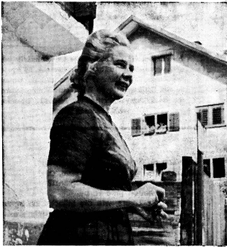
Alva Myrdal anlässlich ihres Aufenthaltes im bündnerischen Schiers

W. — Die Leiterin der sozialwissenschaftlichen Abteilung der UNESCO, die charmante, blonde, 1902 geborene Schwedin Alva Myrdal, wurde zu di-