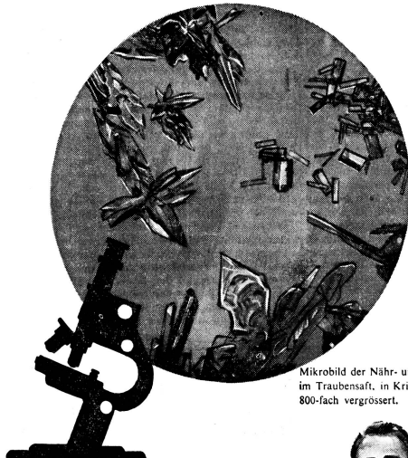
Mikrobild der Nähr- und Aufbaustoffe im Traubensaft, in Kristallform, 400- 800-fach vergrössert.

Die interessante GALERIE mit bestge- führtem RESTAURANT und täglichen Konzerten am Flügel