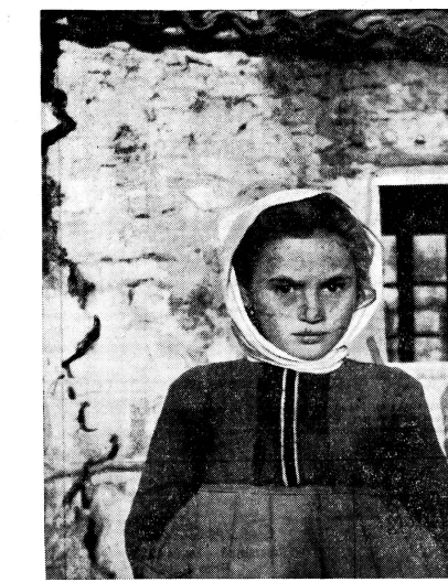
Schönheit und Not ergeben eine Trauer in diesem Mädchenantlitz, die uns seltsam berührt. Das Kind lebt in einem der zerstörten Bergdörfer in Nordgriechenland, in dem die Schweizer Europahilfe nun beim Wiederaufbau helfen möchte.

Der Bundesrat hat auf Antrag des Departements des Innern und der Eidgenössischen Kunstkommission für das Jahr 1956 die Ausrichtung von Auf-