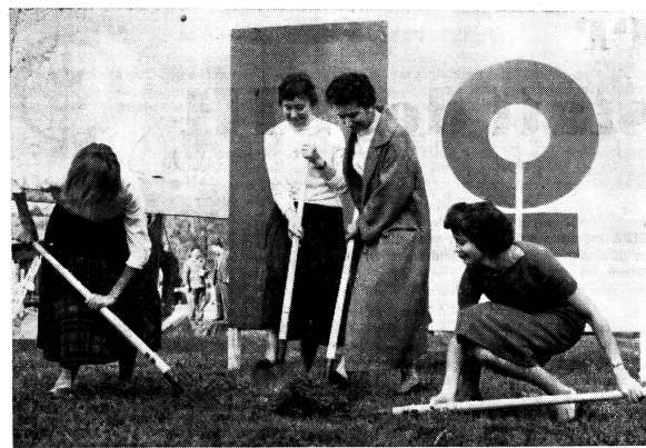
«Hier haben wir die Saffa 1958, die zweite Ausstellung „Die Schweizer Frau, ihr Leben, ihre Arbeit“, sprachen in ihrer Muttersprache beim ersten Spatenstich auf dem Ausstellungsgelände am 17. Oktober die junge Welsche, die Tessinerin, die Vertreterin Romanisch-Bündens und die Deutschschweizerin.