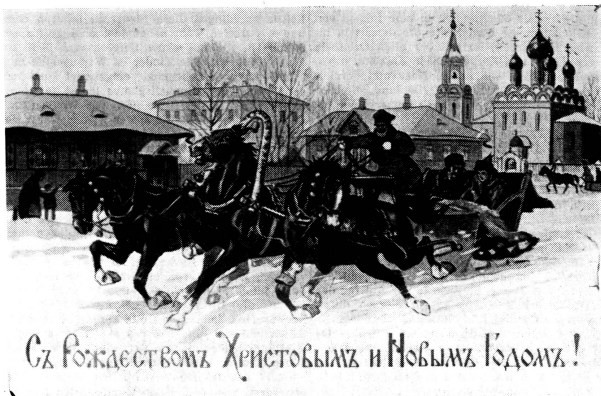
Съ въжакетъ воваъ Христовымъ и Новымъ Годомъ!

Zum Christbaum wurden immer viele bekannte Kinder eingeladen, und mein Onkel dachte für uns stets interessante Spiele aus. Unter dem Weihnachtsbaum lagen Geschenke für alle Anwesenden. Wenn die Kerzen niedergebrannt waren, wurden sie verteilt. Die Mädchen bekamen gewöhnlich Puppen, die alle gleich gross waren, damit sich niemand beleidigt fühlte, tragen aber verschiedene Kleider. Die Buben erhielten Bücher, Pferdchen und anderes Spielzeug — auch alles von derselben Qualität. Ich habe niemals mit Puppen gespielt und liebte nur