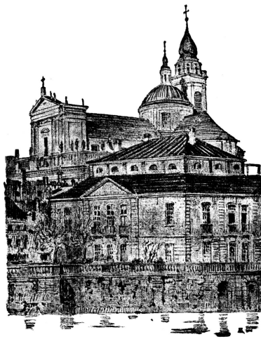
Solothurn, Besenval-Palais und St. Ursen-Kathedrale

aus Gründen mangelnden Raums verzichten müssen, ebenso verweisen wir auf A. J. Wetti «Die Heilige von Tenedo», Morgarten-Verlag. Es ist etwas vom Geiste der Heiligen Verena, der Wundertätigen mit dem Wasserkrüglein aus der nach ihrem Namen benannten Schlucht, in den Solothurnerinnen lebendig geblieben», schreibt unsere Chronistin, «wie sich