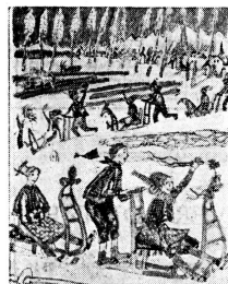
Besuchsquellen für UNICEF-Karten

Die Predigten sind in der Schweiz erhältlich durch das Taubstummen-Pfarramt des Kantons Zürich, Frankengasse 6, Zürich 1.