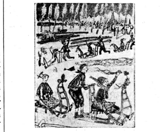
Besuchsquellen für UNICEF-Karten

Die Predigten sind in der Schweiz erhältlich durch das Taubstummen-Pfarramt des Kantons Zürich, Frankengasse 6, Zürich 1.