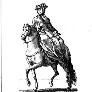
Eine Frau mit die Schönheit respektive. Une epouje a cheval le jour de ses nocces.

Mutergottes gestickt, auf dem Adam und Eva so viele biblische Szenen, neben den Wappen Heidegger und Keller dargestellt sind. Dabei war die Stückerin erst sechzehn Jahre alt und verstand es auch, die lateinischen Spruchbänder richtig einzusetzen. Sie hat das grosse Werk wohl anlässlich der thronvollem Ernennung ihres Vaters zum Zunfmeister in Angriff genommen und beweist mit dieser bedeutenden Stückerlei ein Geschmack der Zeit ihr Können und ihre Ausdauer schon im jugendlichen Alter. Ein belabtes Thema für Wandbehänge waren auch die sogenannten Weiberlisten, die zeigten, wie die Frauen ihr Geger manchmal durch eine kleine List überwinden oder überführen konnten. Zahlreiche Bildteppiche im Landesmuseum erzählen von den damals beliebten Szenen, die nicht selten aus Bilderbüchern übernommen wurden.