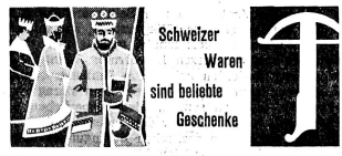
Schweizer Waren sind beliebt Geschenke

Die Begegnung mit dieser Frau beeindruckte mich