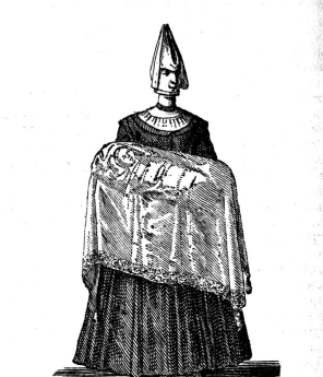
Eine Schenkin des Hund des Hundes. La Sagefemme portant l'enfant au Bapteme.