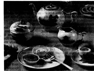
Das handbemalte Porzellan «Alt Zürich» verleiht dem Tisch eine persönliche Note und der Teestunde einen besonderen Charme.

Gespräche über religiöse Dinge waren an diesen Orten verboten. Ebenso wurde keinerlei Glücksspiel geduldet, und Wetten durften lediglich bis zu einer Höhe von fünf Schilling abgeschlossen werden. Die leidenschaftliche Sitte des Rauchens unterlag nur in den Schokoladenhäusern und den vornehmen Lokalen in West-End einer Beschränkung. Der Kaffee wurde schwarz getrunken, manchmal mit einem Ei verquirlt oder durch einen Brandy verstärkt. In einigen Häusern konnte man die ausgezeichneten Aerzte um Rat fragen, wie den Doktor John Radcliff, der die grösste Praxis in London hatte und täglich zur Børszeitung von seiner Wohnung in Bowstreet nach Garway's kam, wo er an einem besonderen Tisch von Wundärzten, Apothekern und Patienten umlagert war. Häufig traten auch politische Redner auf, deren Vorträgen man andächtig lauschte und die man je nach Geschmack mit Beifall oder Missfallensäusserungen bedachte.